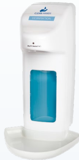
Clean Hands Spender mit berührungsloser Entnahmeautomatik und integrierter Tropfschale