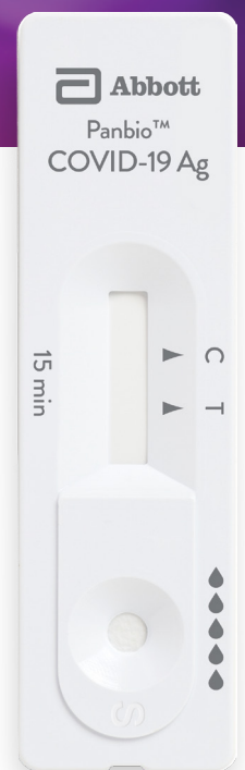
Panbio™ COVID-19 Ag Schnelltestkassette